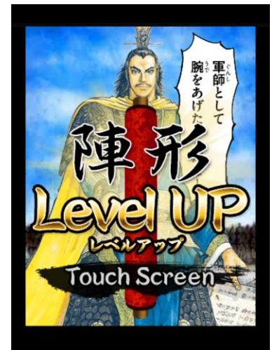
ファン必見のカラービジュアルが登場