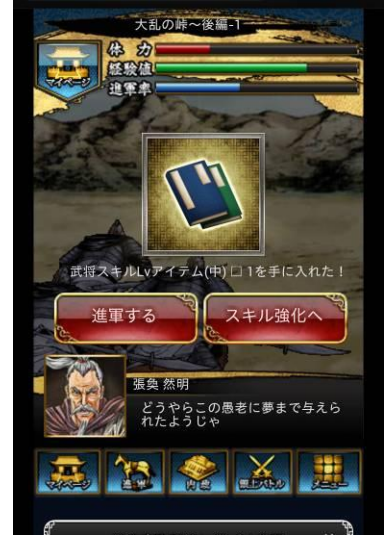
「進軍(クエスト)」アイテム入手