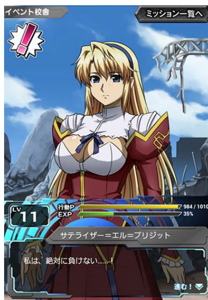
ミッション(クエスト)画面