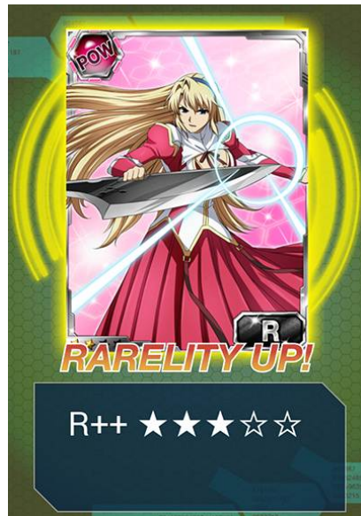
同一カード入手でレアリティが上昇