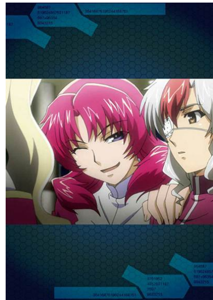
アニメの名シーンも見られる