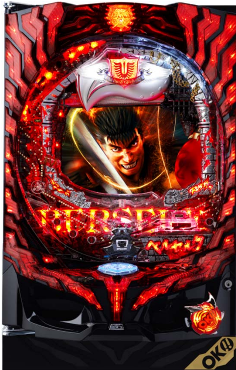
新世紀ぱちんこ ベルセルク