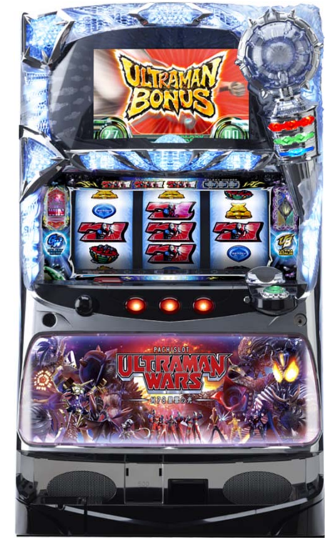
パチスロ ウルトラマンウォーズ