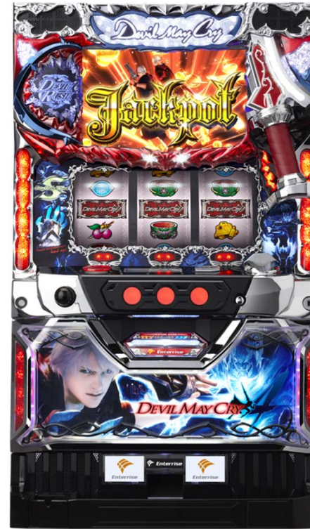
デビル メイ クライ 4