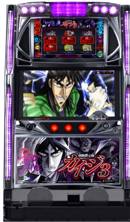
回胴黙示録 カイジ3