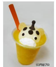
ブースカスムージー