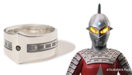
PUERTA DEL SOL × A MAN of ULTRA ウルトラセブンリング TYPE-1 20,520 円(税込)