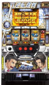
『パチスロ 逆転裁判』

当中期経営計画期間において「短期業績回復」「市場環境に動じない事業構造の構築」「PSソリューションの提供」を図り、労働生産性の向上を推進しています。また、流通商社としてのリレーションの強化により、年間を通じて安定的な商品の提供を図ります。