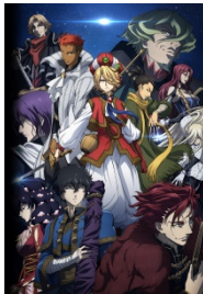
『将国のアルタイル』 © カトウコトノ・講談社 /将国のアルタイル製作委員会

映像作品については、エンタテインメント業界の有力企業や国内外の SVOD (Subscription Video On Demand: 定額制動画配信) 事業者と協力し、グローバル展開及びクロスメディア展開を進めています。