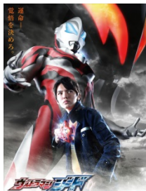
『ウルトラマンジード』

『ウルトラマンシリーズ』は、平成 28 年にシリーズ放送開始 50 年を迎えました。当社グループでは、子供から大人まで世代を問わず愛され続け、日本を代表するヒーローキャラクターへと成長した『ウルトラマンシリーズ』を、国内外のパートナーと協働でクロスメディア展開しています。