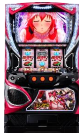
パチスロ 百花繚乱 サムライガールズ