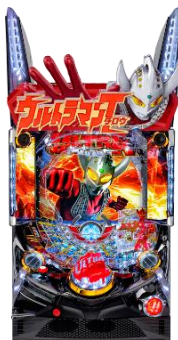
ぱちんこ ウルトラマンタロウ 2