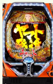
P 宇宙戦艦ヤマト 2202 愛の戦士たち