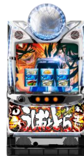
S うしおとら 雷槍一閃